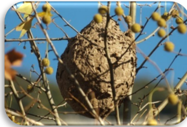
Nest der Asiatischen Hornisse