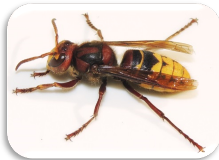
Europäische Hornisse