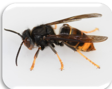
Asiatische Hornisse