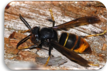
Asiatische Hornisse

– ein neuer Bienenschädling bedroht die Bienenvölker –