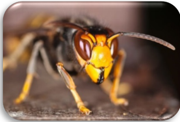
Asiatische Hornisse