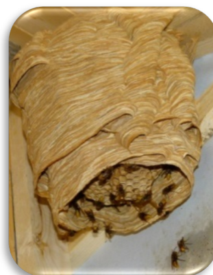
Nest der Europäischen Hornisse